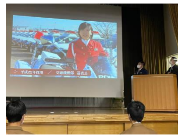
栃木県警察説明会