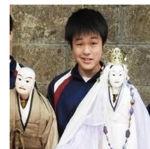
上写真 下野新聞掲載 2021年5月5日(水) 地元の伝統芸能 「奈佐原文楽」