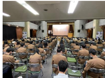
宇都宮公共職業安定所講話