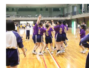
女子 ドッジボール