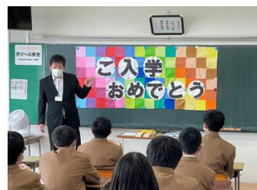
今後の学校生活について