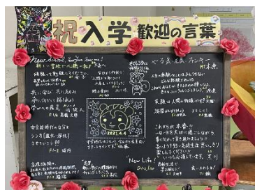
「歓迎の言葉」メッセージボード