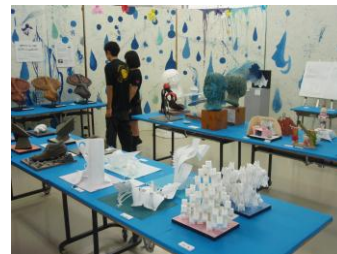
美術デザイン科展示