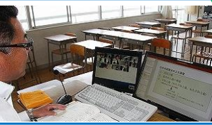
英進部 1年 B