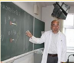
英進部 1年 C