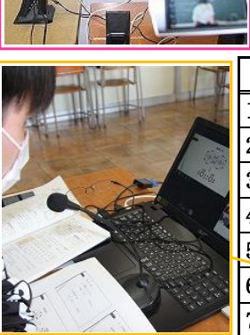
英進部 1年 A