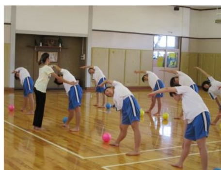
講座 12 ストレッチとリズム体操を覚えよう