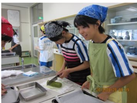
講座 13 クッキー作り