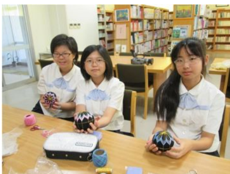
講座 21 伝統工芸<てまり>を作ろう！