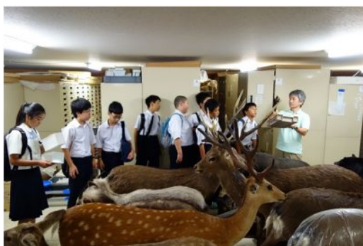
講座 16 県立博物館を探検しよう。