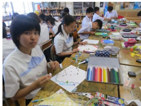
講座 8 手作り時計をつくろう