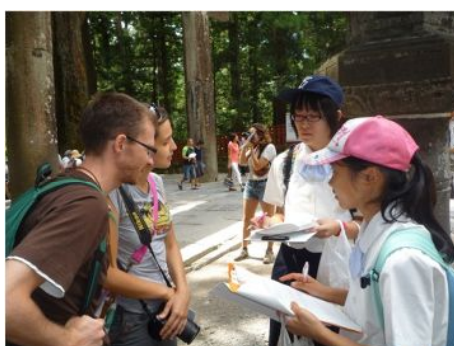
講座 18 インタビュー in 日光！