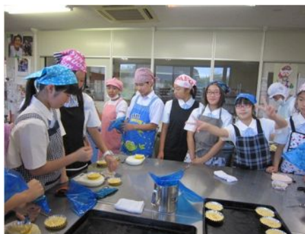
講座2 心の輪を広げよう！