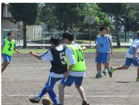
講座 9 フットサル