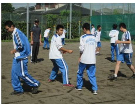
講座 11 三歩取りと六虫