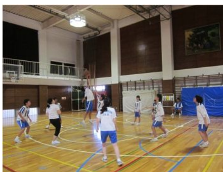
講座 20 バスケットボール