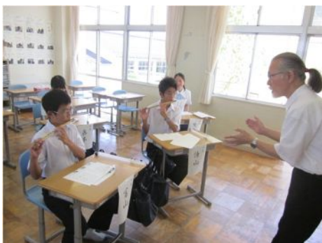
講座 7 篠笛に挑戦！