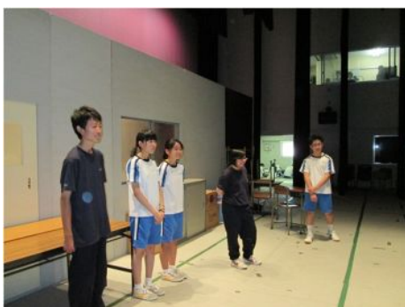
講座 15 演劇