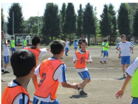
講座 17 ハンドボール