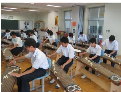
講座 19 琴の音を奏でよう