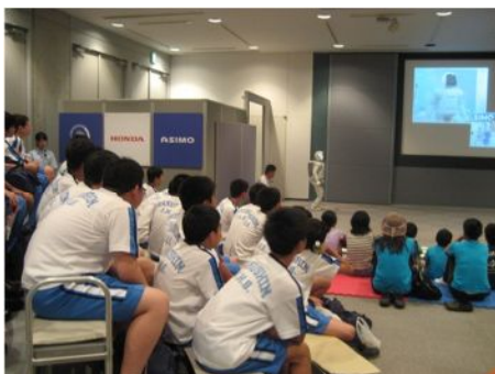
講座5 ツインリンクもてぎに行こう！