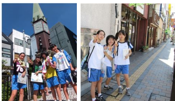
講座 10 宇都宮探検隊！