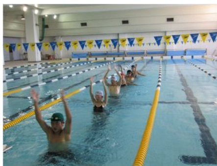
講座4 ウォーターボーイズ & ガールズ 2013