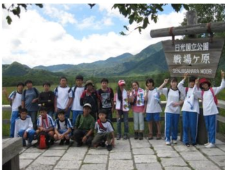
講座1 そうだ！日光へ行こう！